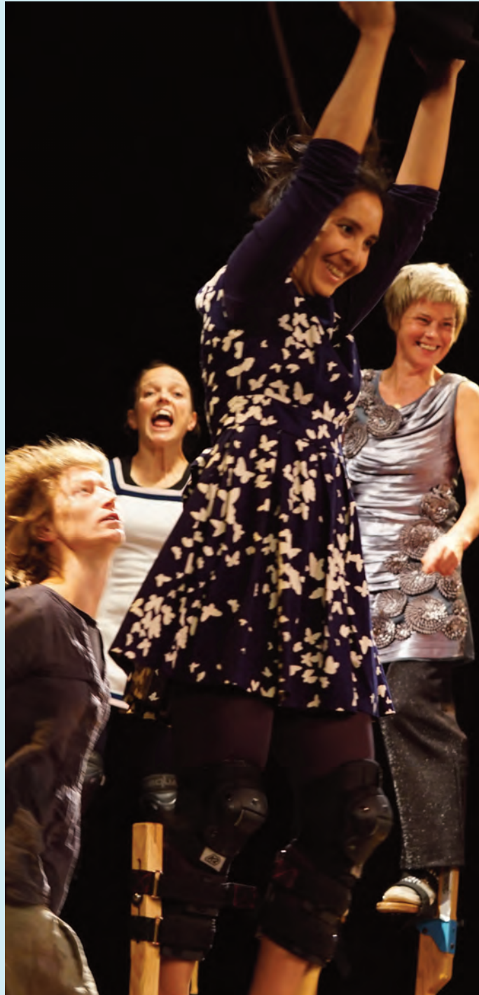
„beziehungsweise“ - Abschlusstück A 5